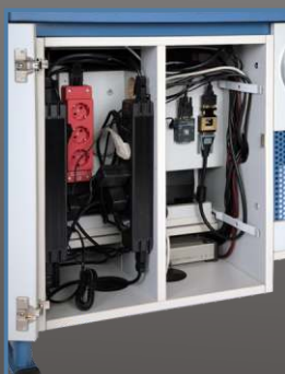
Revisionsöffnung und Verkabelungstechnik

Mediencontainer mit integrierter Mittelwand, zur Trennung der signalführenden Kabel und der 230-Volt-Verkabelung (auch im Revisionsfach und horizontalen Stahlblechkabelkanal getrennt), in der Bodenplatte zwei Kabeldurchlässe, z.B. zur Kabeleinführung aus dem Fußbodenkanal